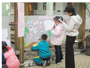
师生参与共同评价