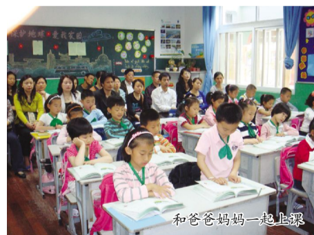
和爸爸妈妈一起上课