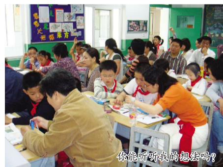
你能听听我的想法吗?