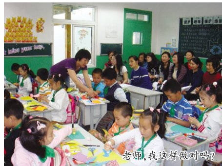
老师,我这样做对吗?