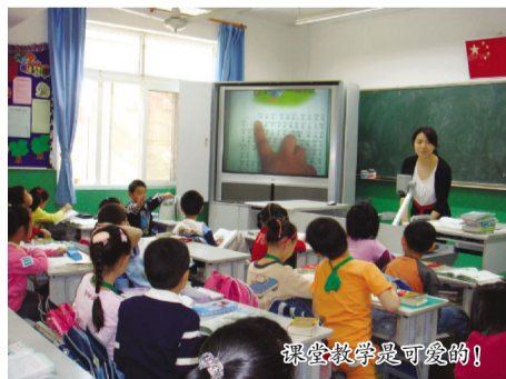
课堂教学是可爱的!

学生、老师与家长进行零距离的接触,在活动中增进了大家的交流和沟通,真正实现了“开放日”这一平台的互相学习交流提高的作用。这次活动,家长的参与面较广,课堂教学中,在老师们的引导下,学生们学得主动、学得快乐、学得成功。家长们都听得非常认真,看到孩子们学得如此生动活泼,个个露出了满意的笑容。活动后,家长们从不同角度进行了信息反馈,许多家长在评课中,对执教老师的教学态度、教学方法、教学过程和教学理念都表示非常满意。通过开放日活动,让他们更多地了解了学校教育,了解了老师对孩子的付出。家长开放日为家校共同培养孩子架设了一座桥梁。有的家长还提出了希望多开展此类活动,让家长更多了解学校,了解自己孩子在学校的学学习情况,及时发现孩子的缺点进行教育。本次家长开放活动,从活动中和家长的建议中,我们也有了更好的启示,相信我们今后的工作会做得越来越好! 特约通讯员 王晓云